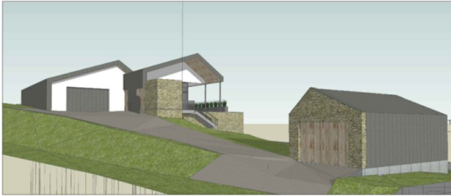
ANSICHT VON NORDWESTEN - ZUFAHRT UND NEBENGEBÄUDE