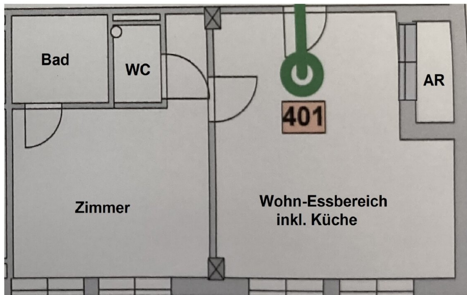
Top 401 4. Stock