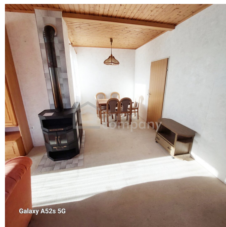
Galaxy A52s 5G