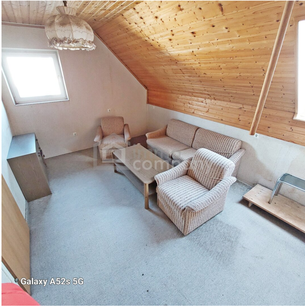
Galaxy A52s 5G