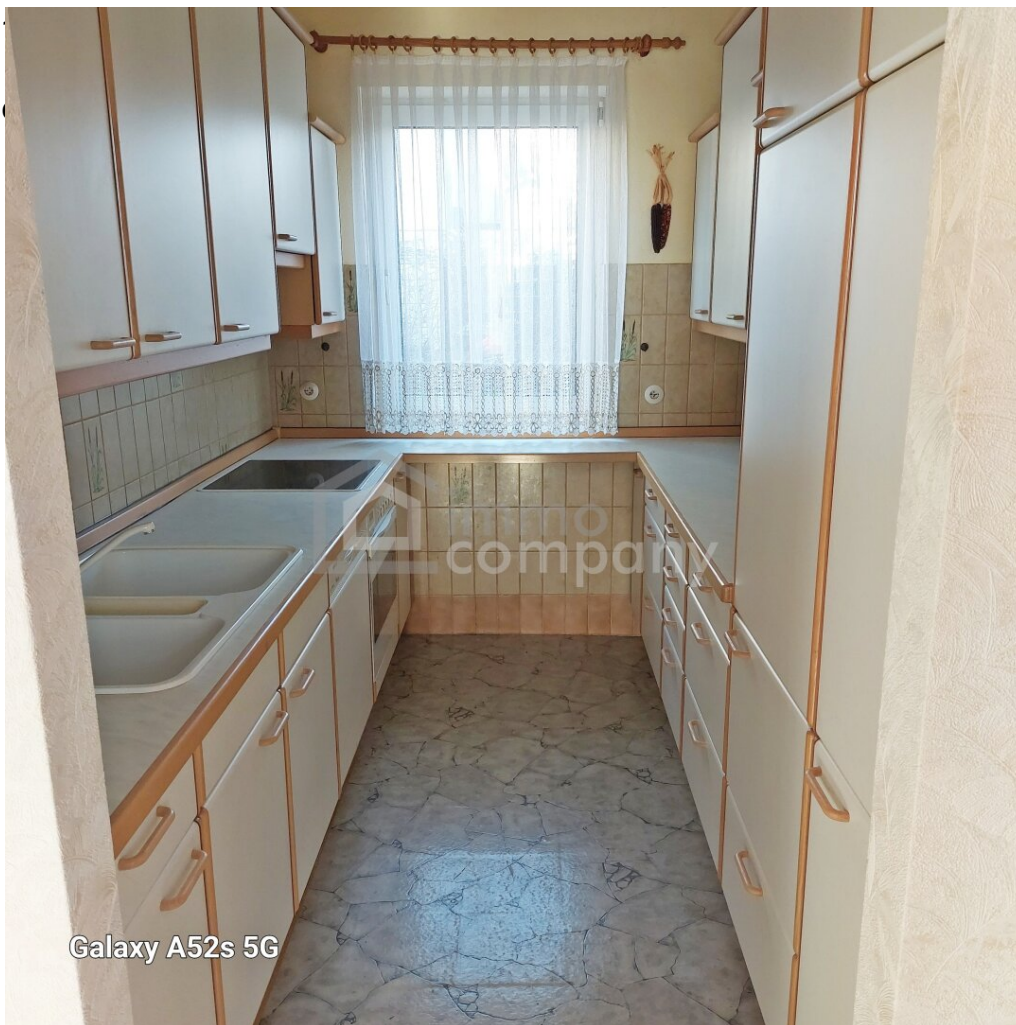
Galaxy A52s 5G