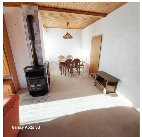
Galaxy A52s 5G