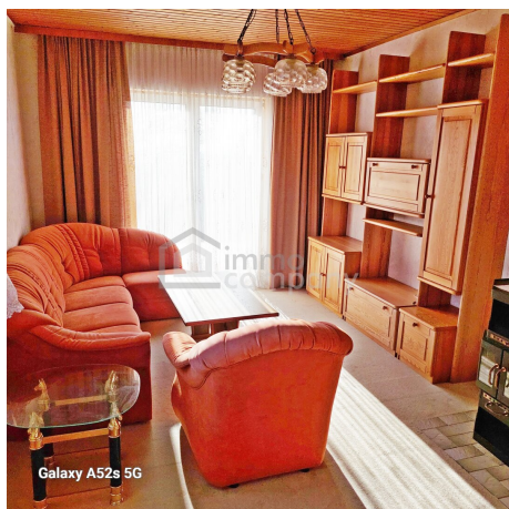
Galaxy A52s 5G