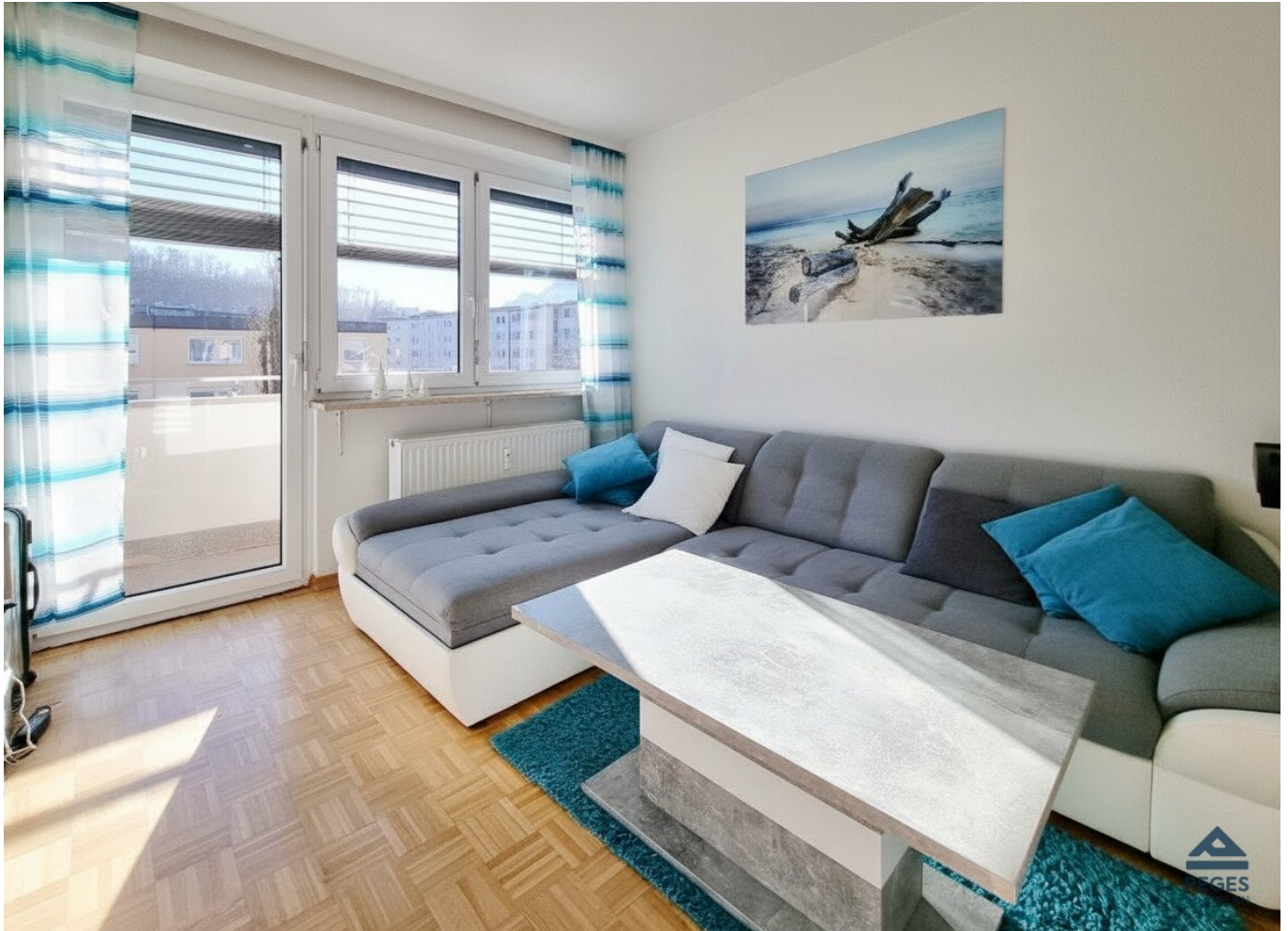
Wohnzimmer mit Balkon-Zugang

Objektnummer: 7230/613 Eine Immobilie von Peges