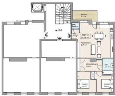
LAGEPLAN 1/200 PILGRAMGASSE 15