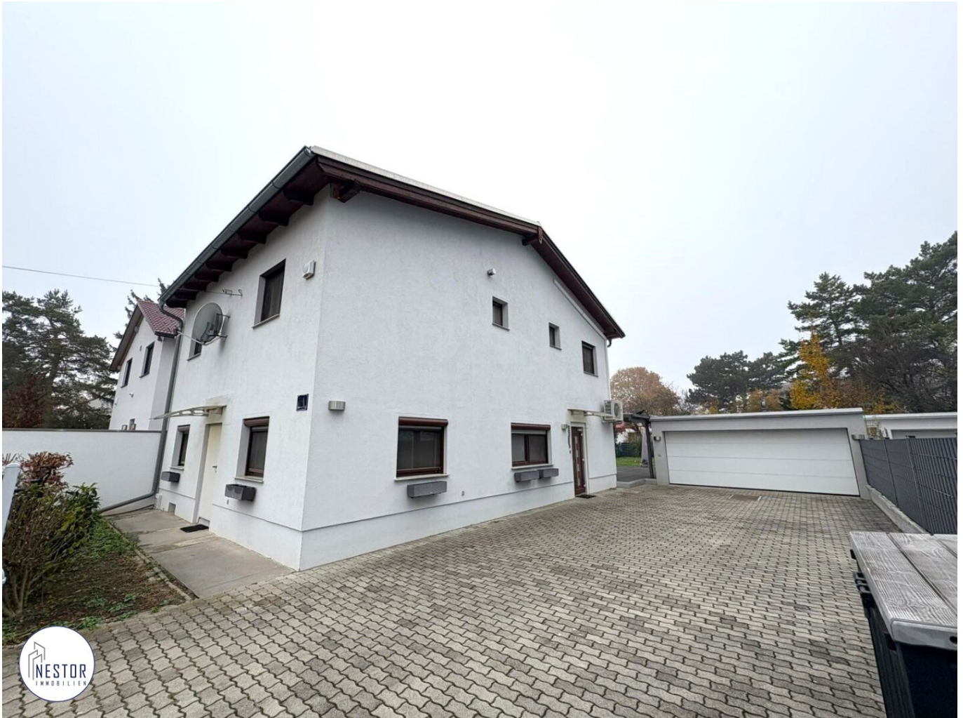
Haus - NESTOR Immobilien