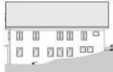
ANSICHT - SÜD: