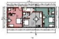
UNTERGESCHOSS / SCHEUNE - UMNUTZUNG ZU 3 APPARTEMENTS: