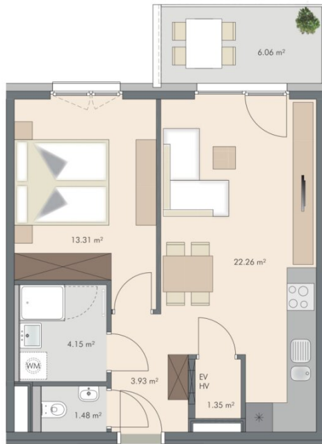
TOP 42 46.48 m² 2 Zi.