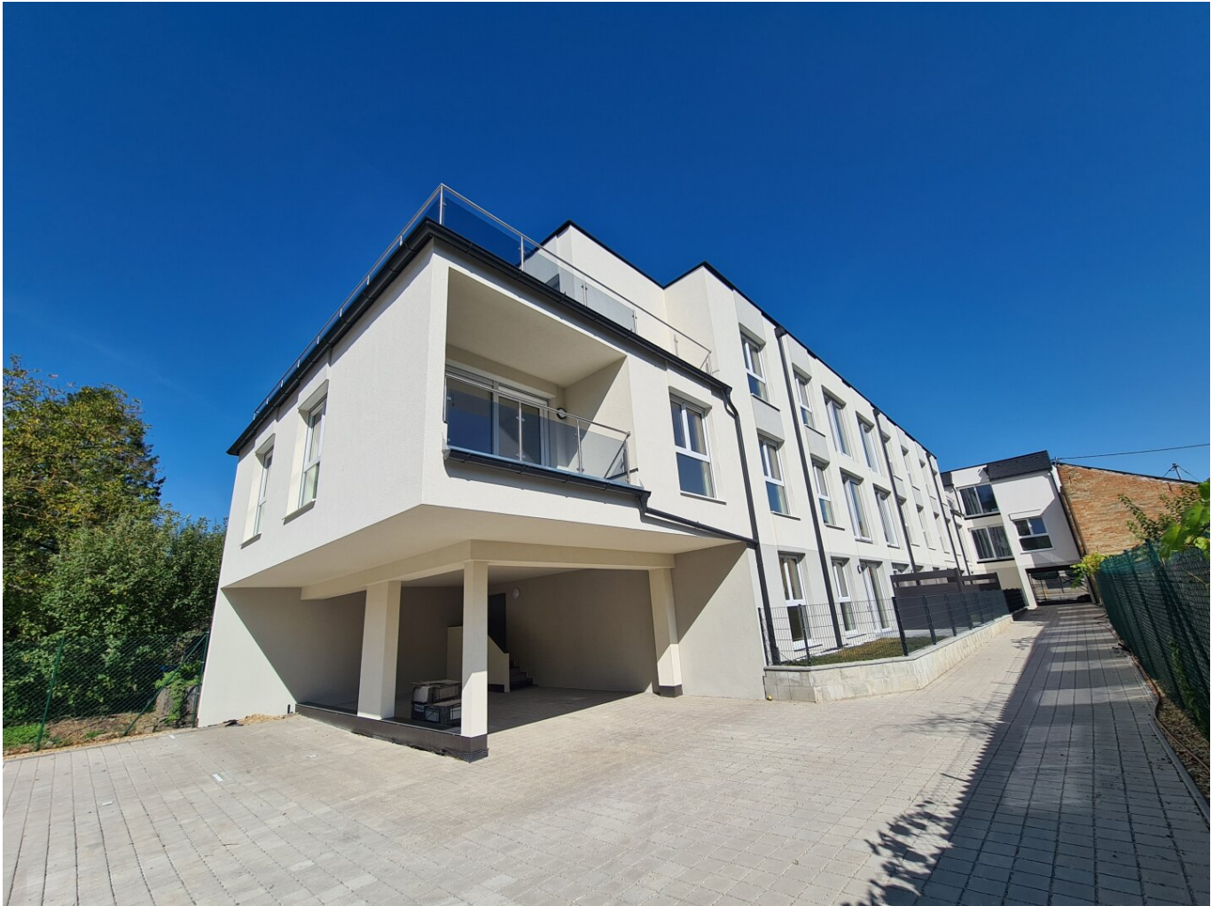
Innenbereich der Wohnhausanlage