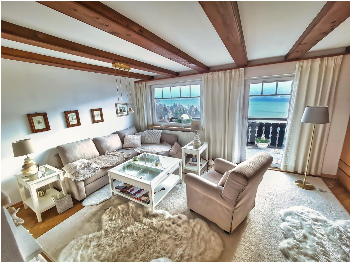
Wohnzimmer mit Balkon und Seeblick