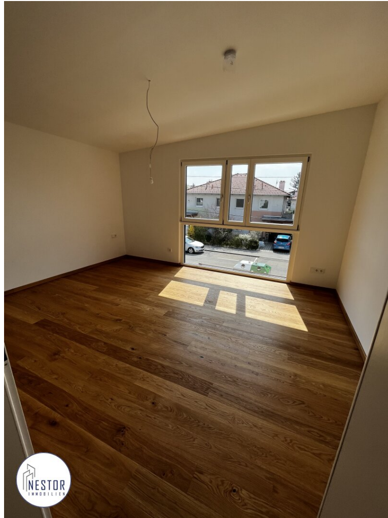
Haus - NESTOR Immobilien