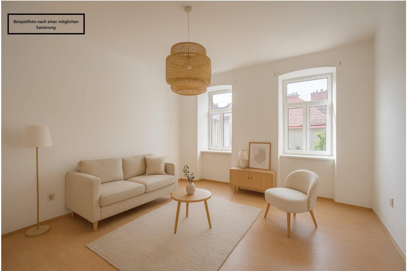
Beispielfoto nach einer möglichen Sanierung