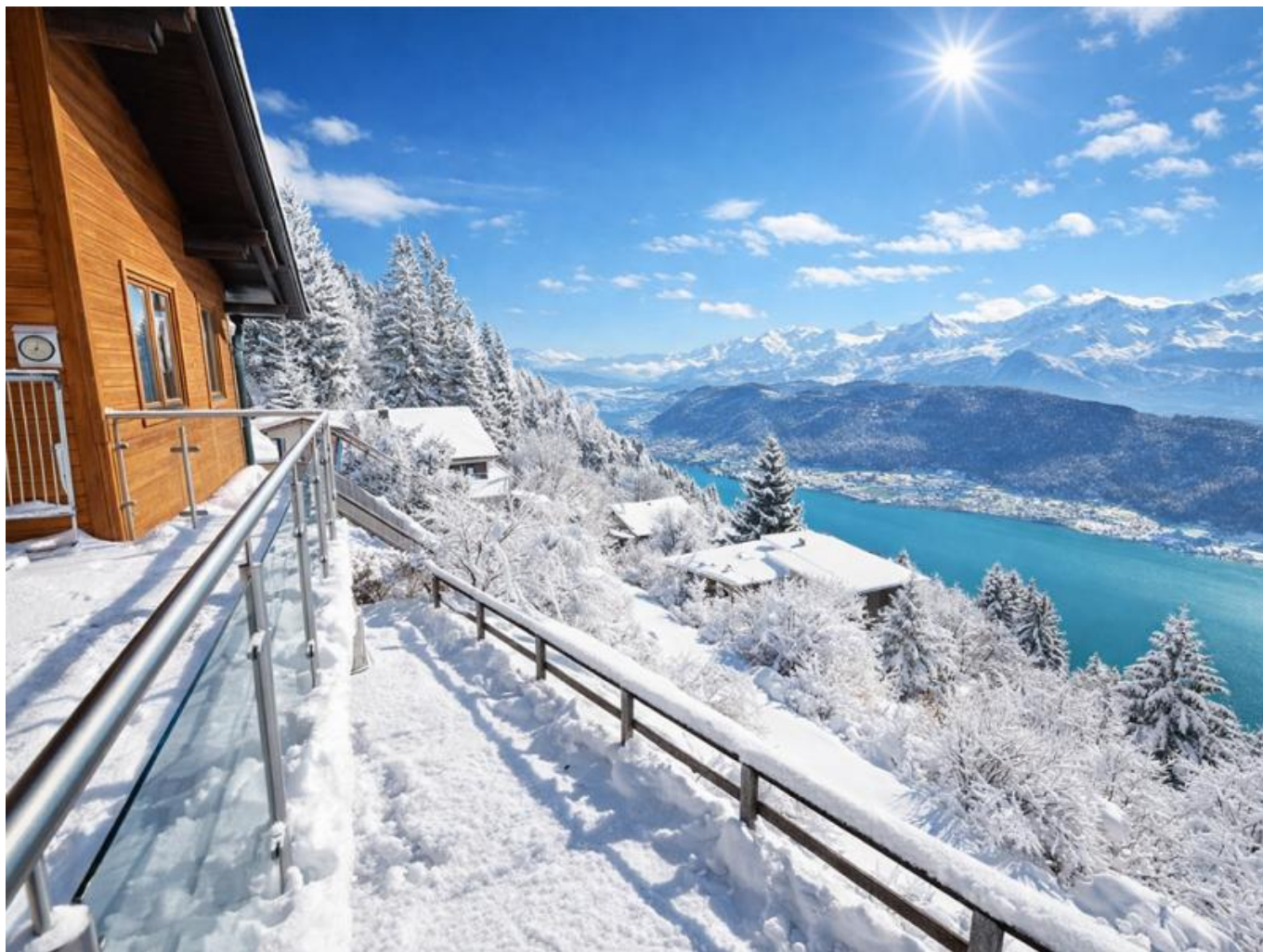
Chalet Ossiacher See

Objektnummer: 905/03576 Eine Immobilie von ATV Immobilien