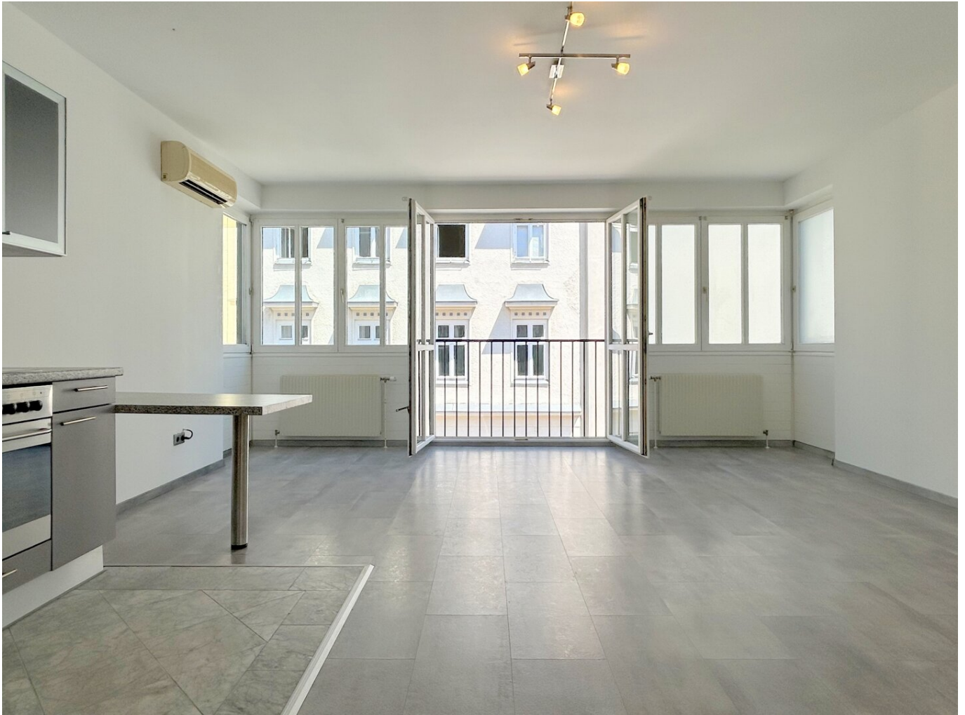
Wohn-Schlafrum mit französischem Balkon