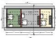
DACHGESCHOSS / SCHEUNE - UMNUTZUNG ZU 3 APPARTEMENTS: