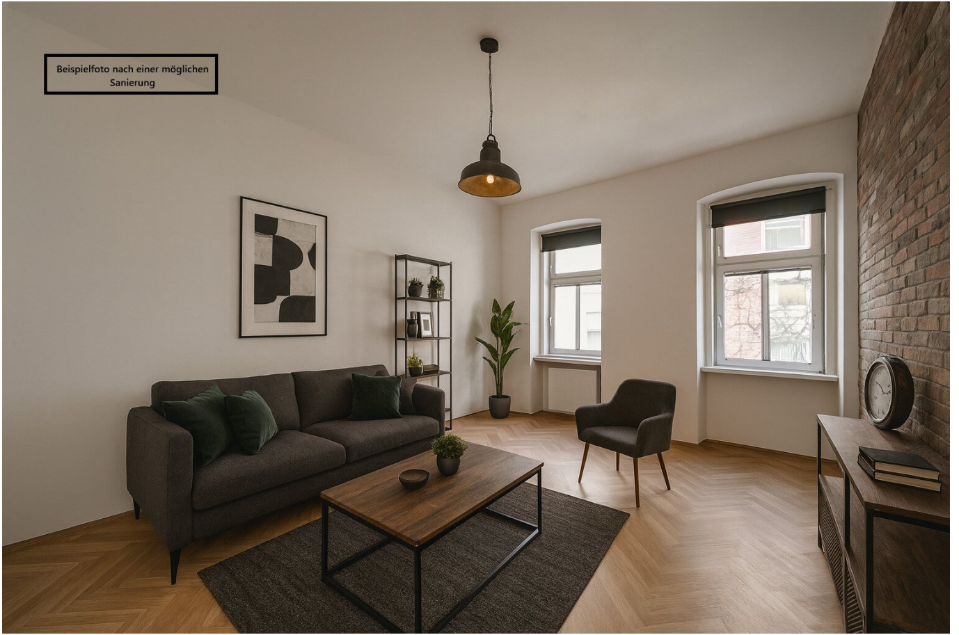
Beispielfoto nach einer möglichen Sanierung