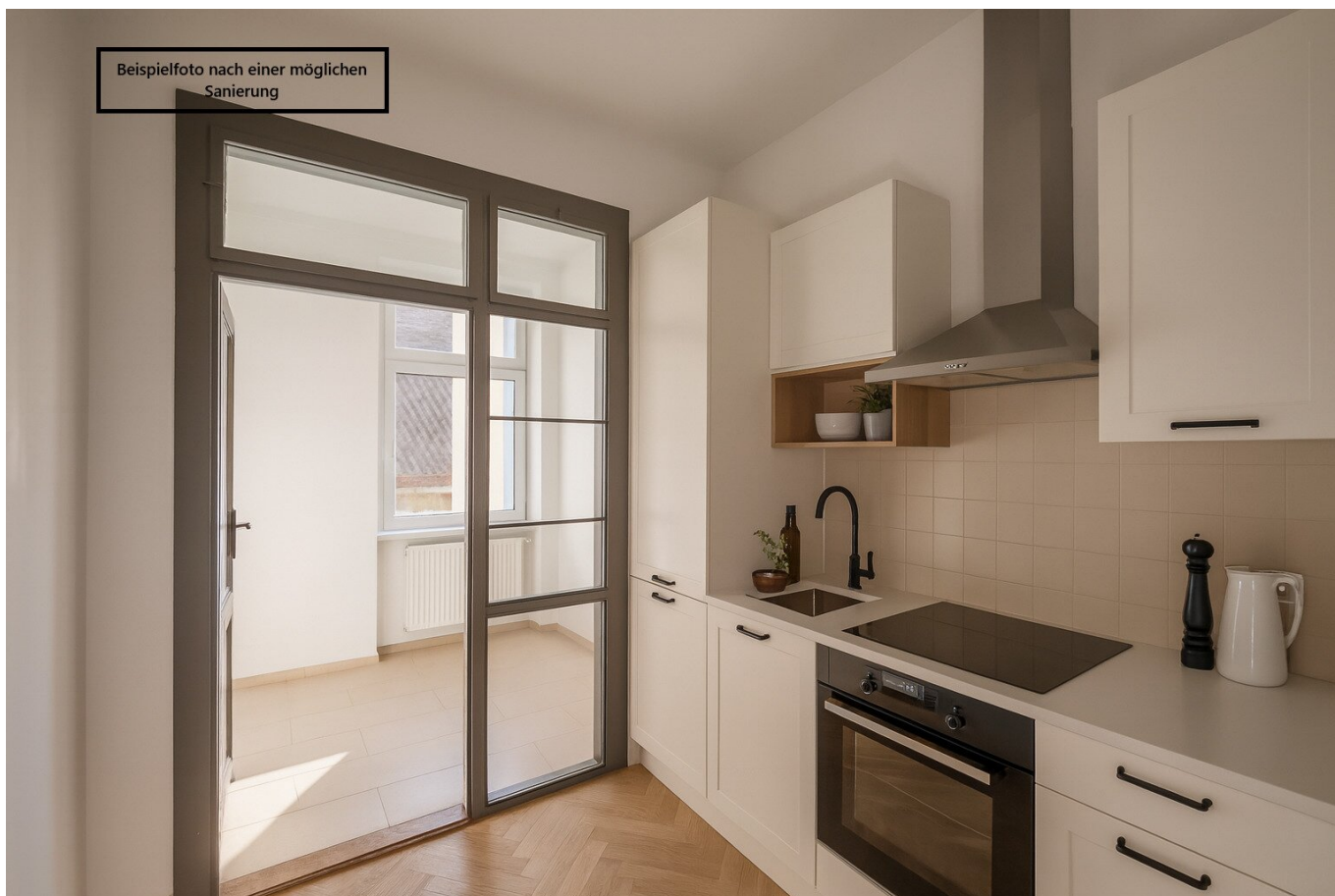
Beispielfoto nach einer möglichen Sanierung