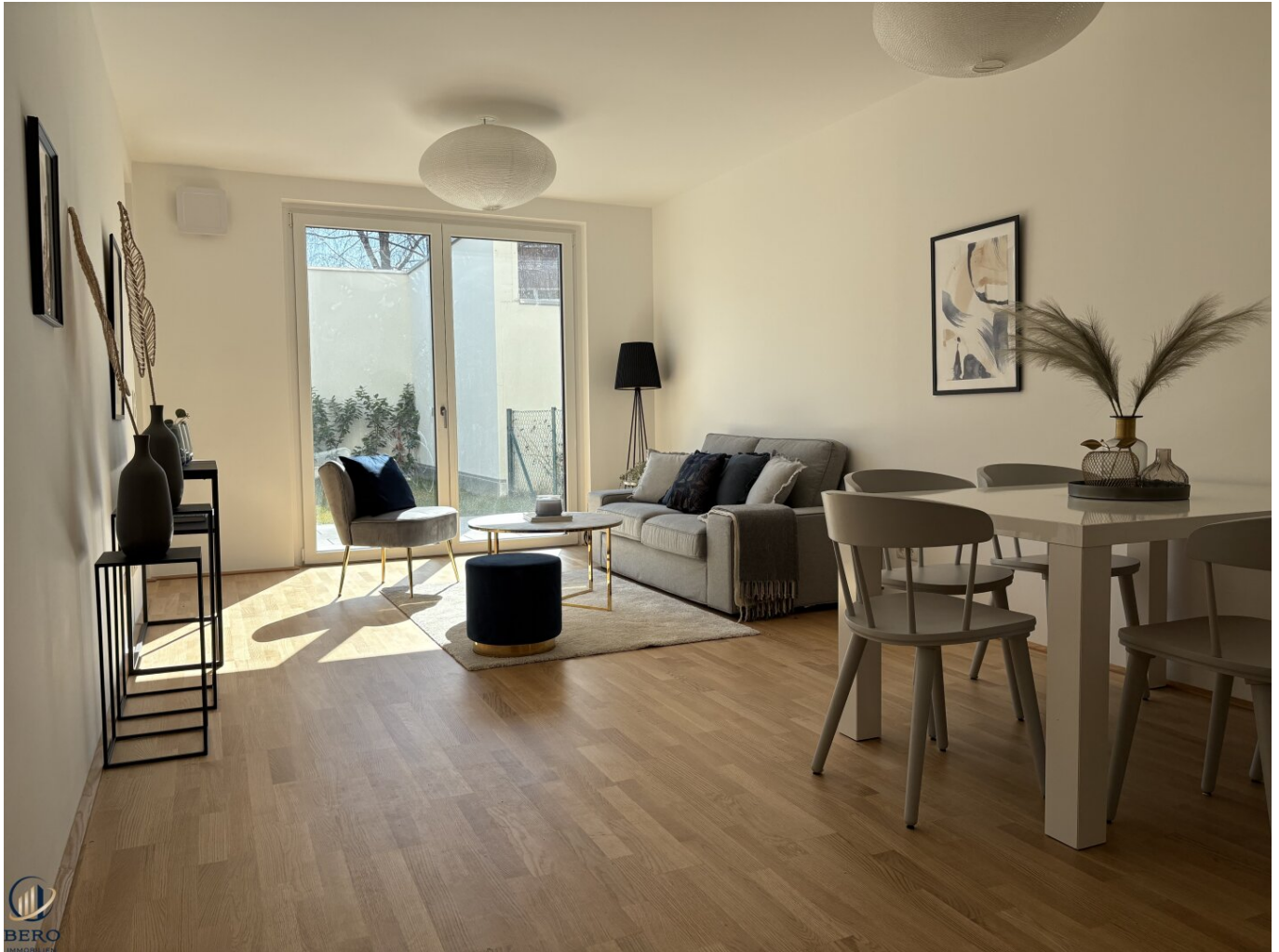
Wohnzimmer Richtung Garten