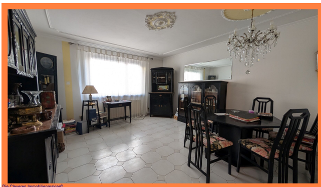
Die Cleveren Immobilienmakler©