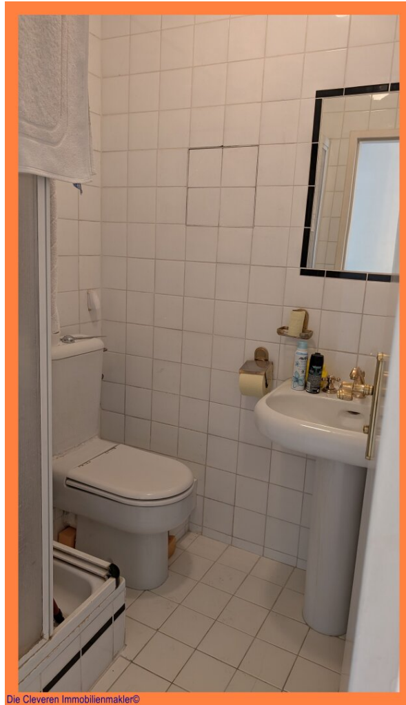
Die Cleveren Immobilienmakler©