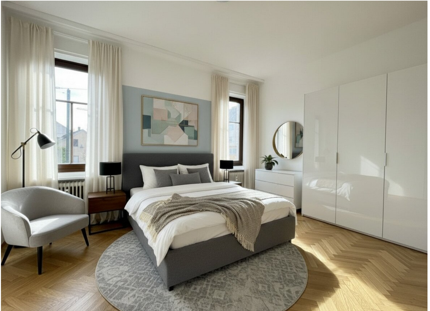
Schlafzimmer eingerichtet - TOP 4