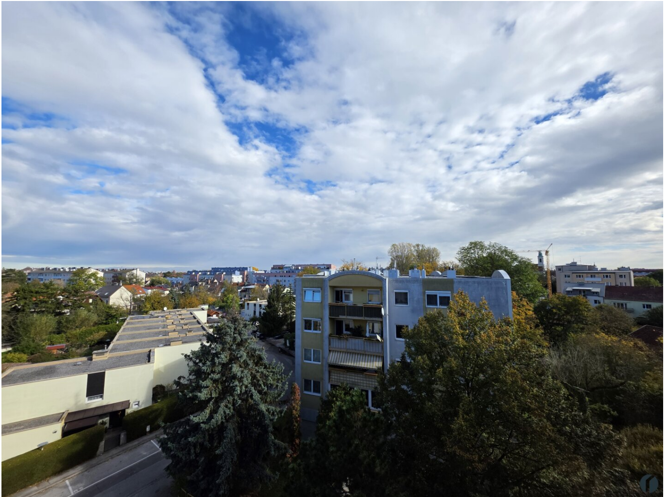
Ausblick Loggia und Wohnzimmer