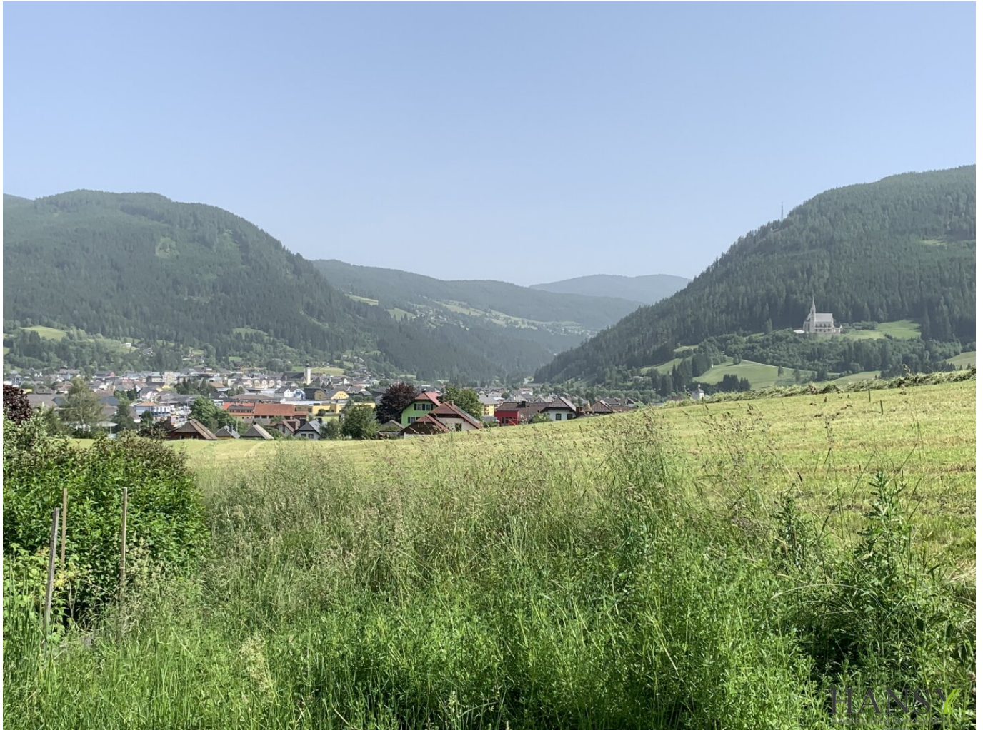
Ausblick von der Liegenschaft