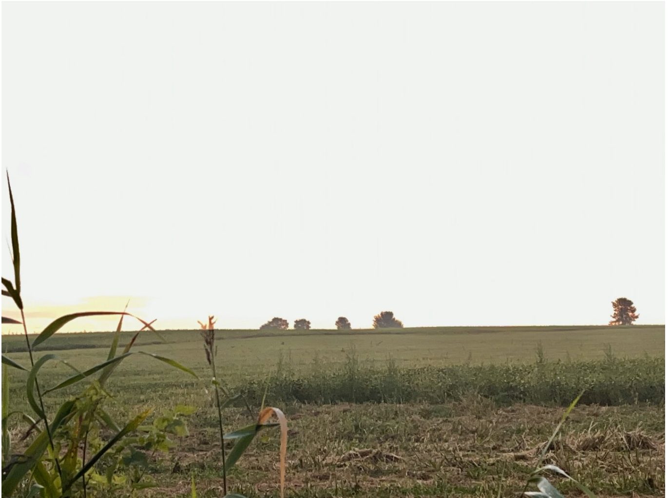
Die Weite - Ausblick nach Süden