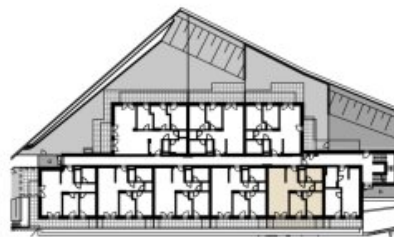
GRUNDRIS BK 03

Unverbindliche Grundrissinformation. Für gelieferte Qualitäten ist ausschließlich die Bau- und Ausstattungsbeschreibung verbindlich. Die dargestellte Möblierung - ausgenommen Waschtische, Dusche, Badewanne, WC - ist nicht Bestandteil des Lieferumfangs und dient nur als Einrichtungsvorschlag. Alle Quadratmeter sind nach Rohbaumaßen berechnet und berücksichtigen keine Wandbeläge wie z.B. Verputz und Fliesen. Änderungen in der Ausführung vorbehalten! Toleranzen bis zu 3% der Gesamtfläche sind möglich. Etwasige Bodenabläufe und Putzschächte im Außenbereich, sowie haustechnische Leitungsführungen im Innenbereich sind in den Plänen nicht dargestellt und werden nach Erfordernis hergestellt.