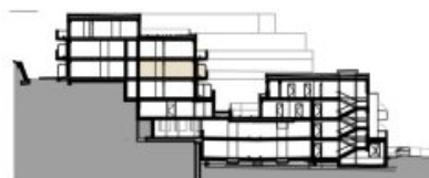
SCHNITT BK 01+03