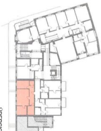
ÜBERSICHT - EG