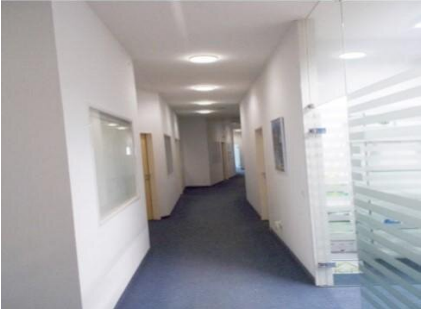
Gang zu den Büros