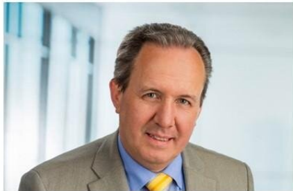
Immobilienmakler auf Augenhöhe