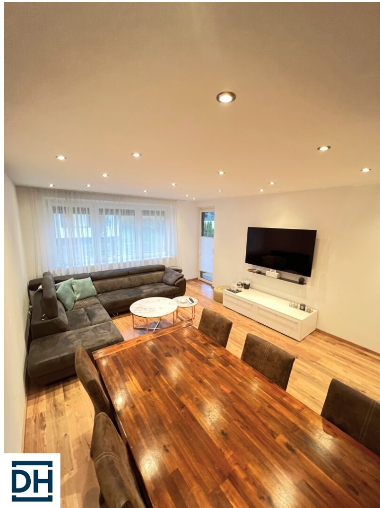
Wohn / Esszimmer