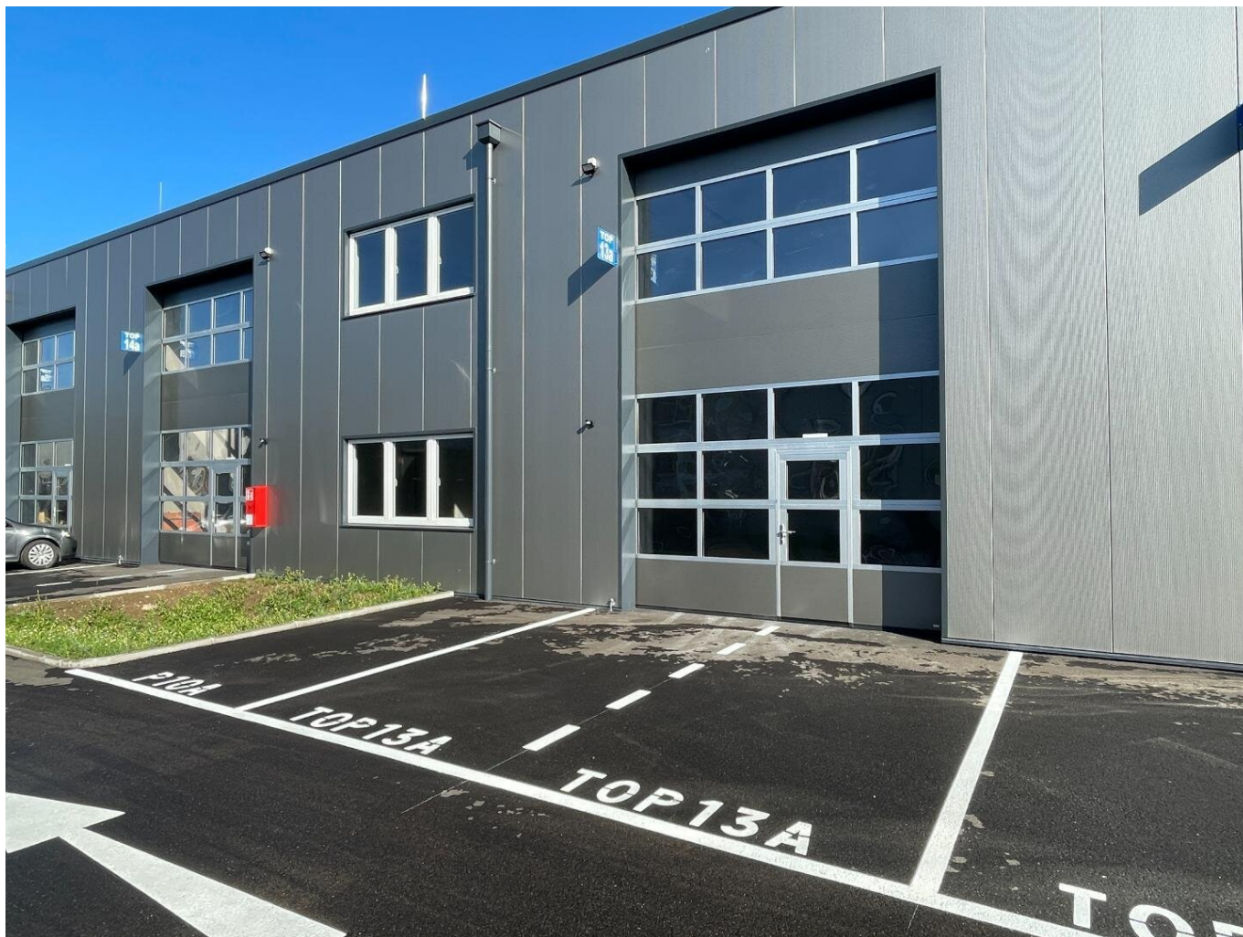
Außenansicht Top 13a

KURZZEITMIETE MÖGLICH! Betriebs-/ Produktions- oder Lagerhalle mit ca. 100 m 2 Fläche im Business Park Regau , 1A-Lage, Nähe A1 Westautobahn - SOFORTBEZUG (Top 13a)