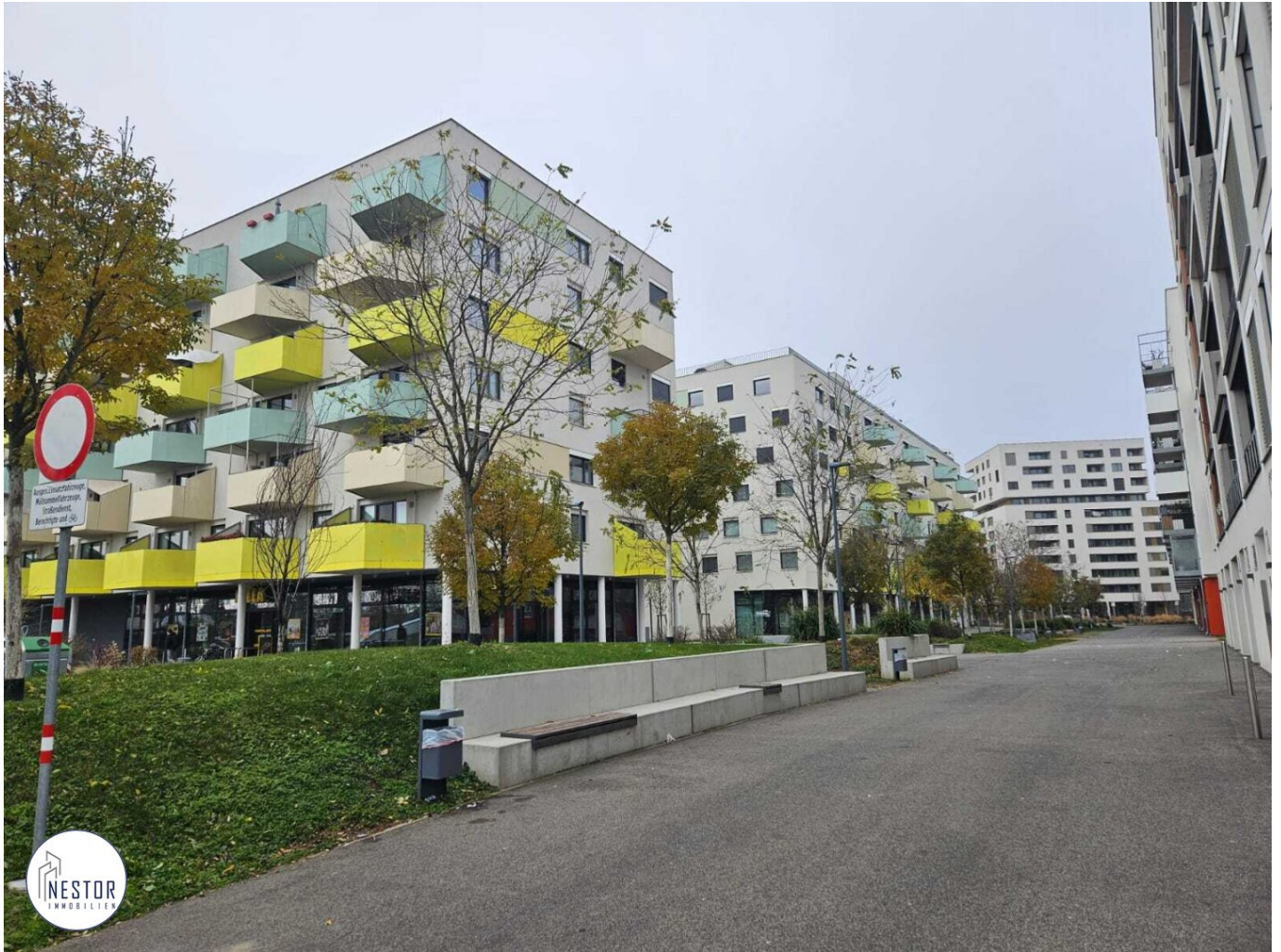
Umgebung - NESTOR Immobilien