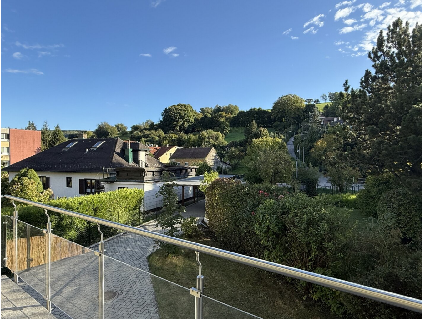
Ausblick vom Balkon

Nahe der ISTA – Wo das Christkind zweimal klingelt!