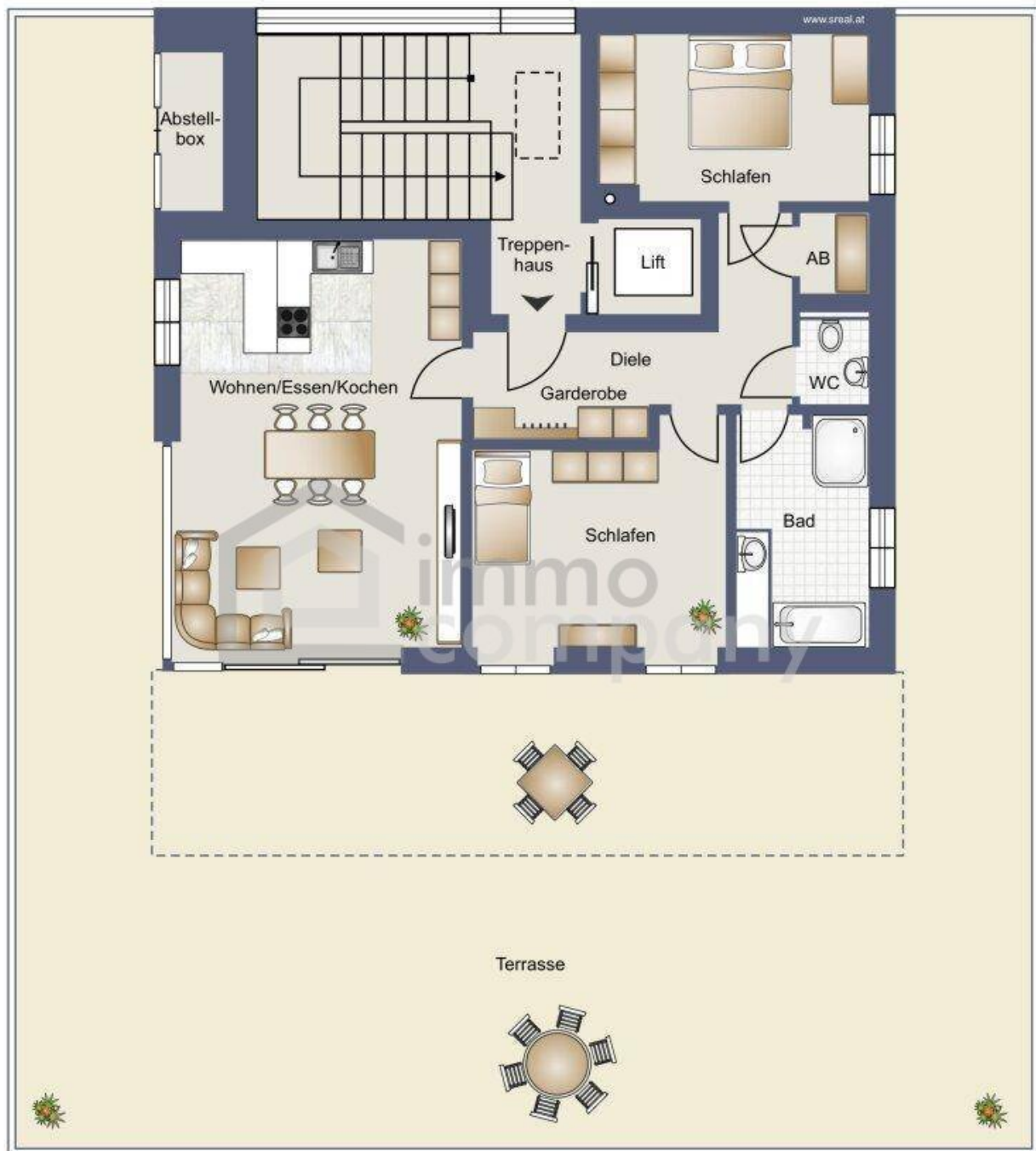
Skizze 2. Obergeschoss/Dachgeschoss