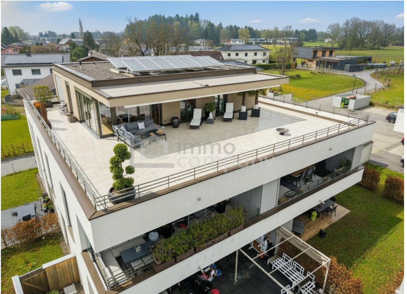
Penthouse - Terrasse 188m 2