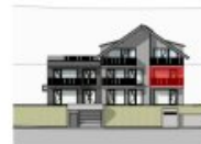
ANSICHT SÜD 1.OG