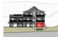
ANSICHT SÜD EG