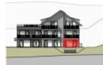
ANSICHT SÜD EG