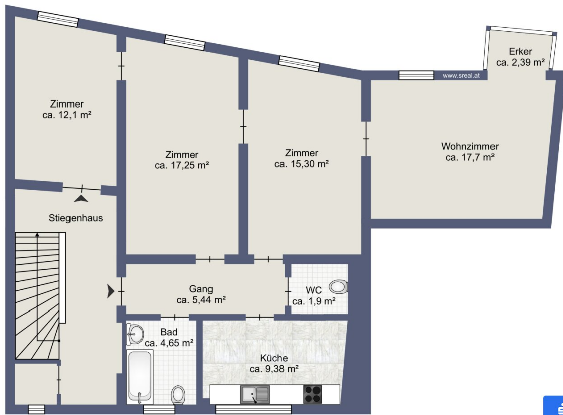
Skizze 1. OG