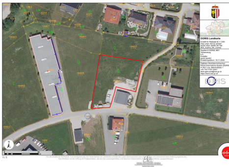
LAGEPLAN Alle Angaben ohne Gewähr