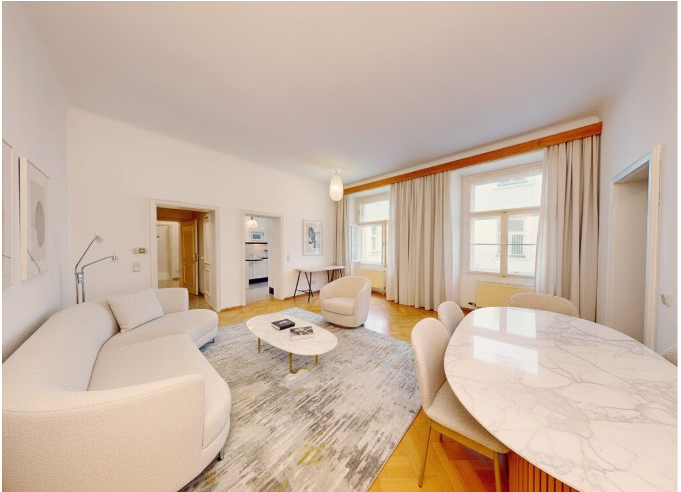
Wohnzimmer (mittels KI möbliert)