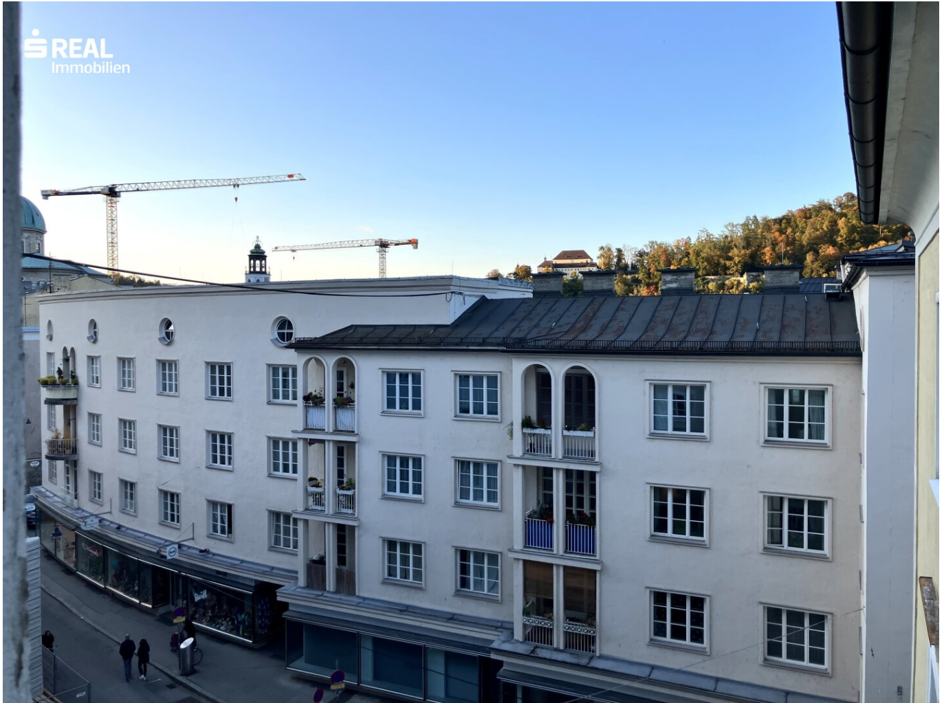
Ausblick bei Abendstimmung