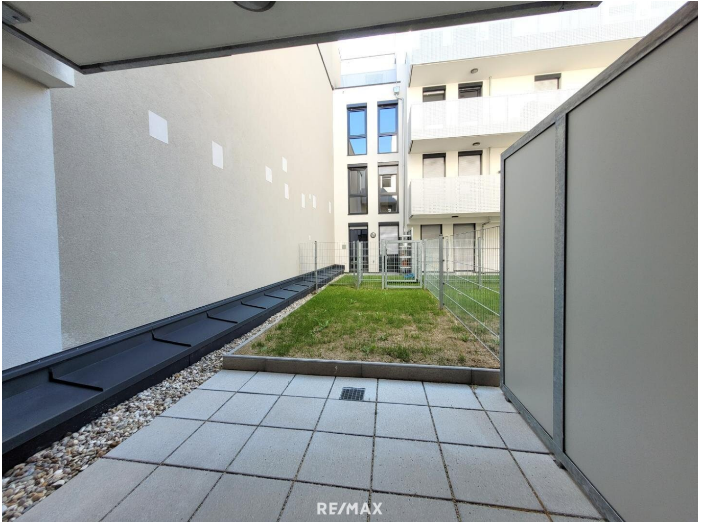
Wohnzimmerterrasse und Garten