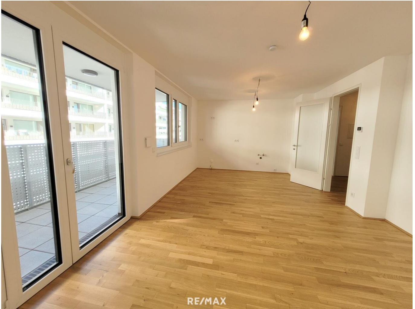
Wohnküche mit Balkonausgang