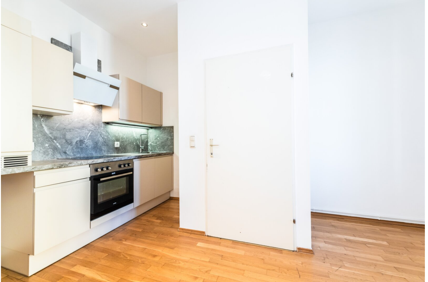
Küche & Essbereich

AB 01.01.2026 VERFÜGBAR | GEGENÜBER FH JOANNEUM | 3. STOCK | MODERN SANIERT | SEHR HELL I BIM VOR DER HAUSTÜRE | HAUSTIERE WILLKOMMEN I PROJEKT WOHNEN