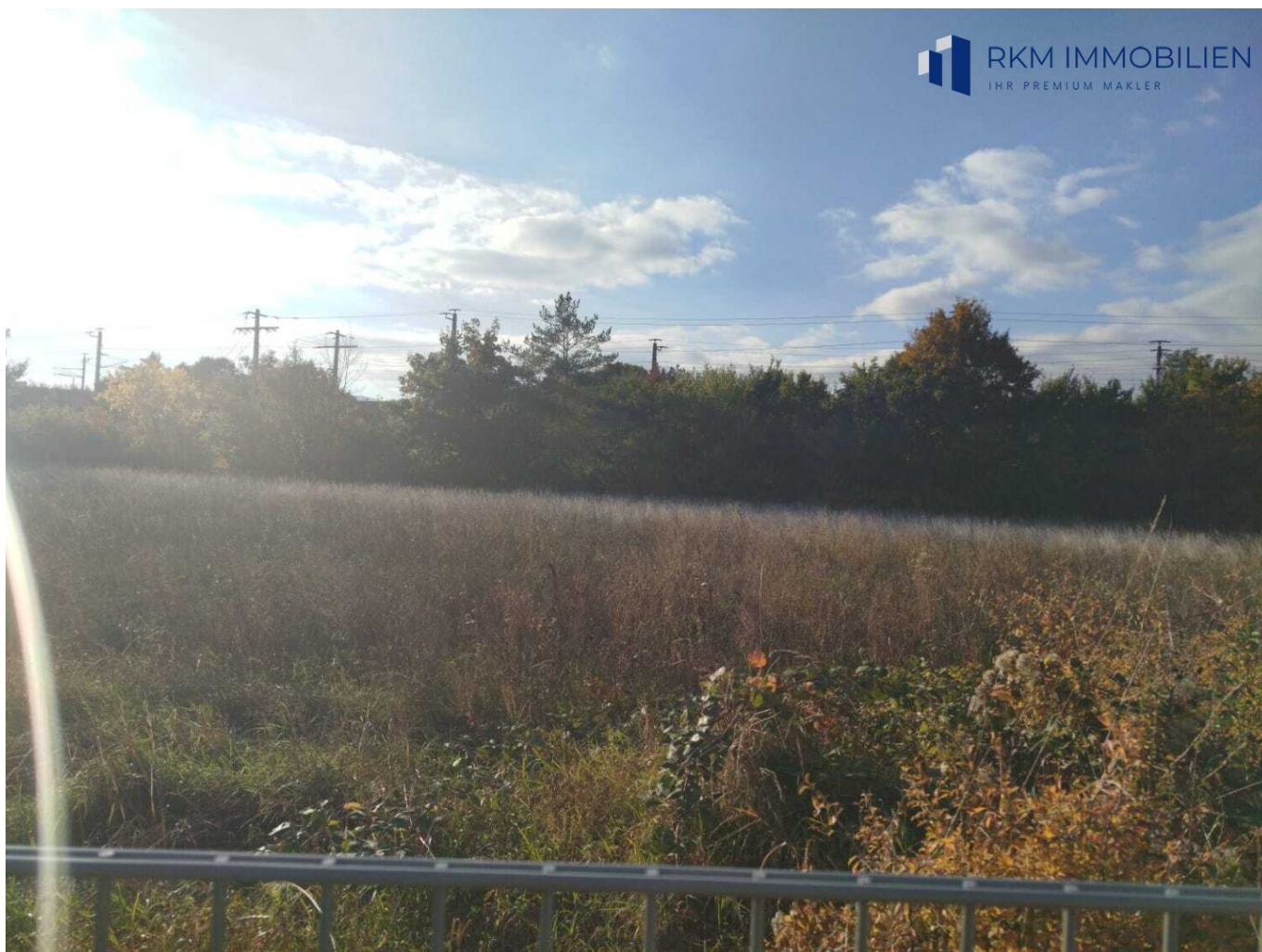
Grundstück Kleingarten Widmung