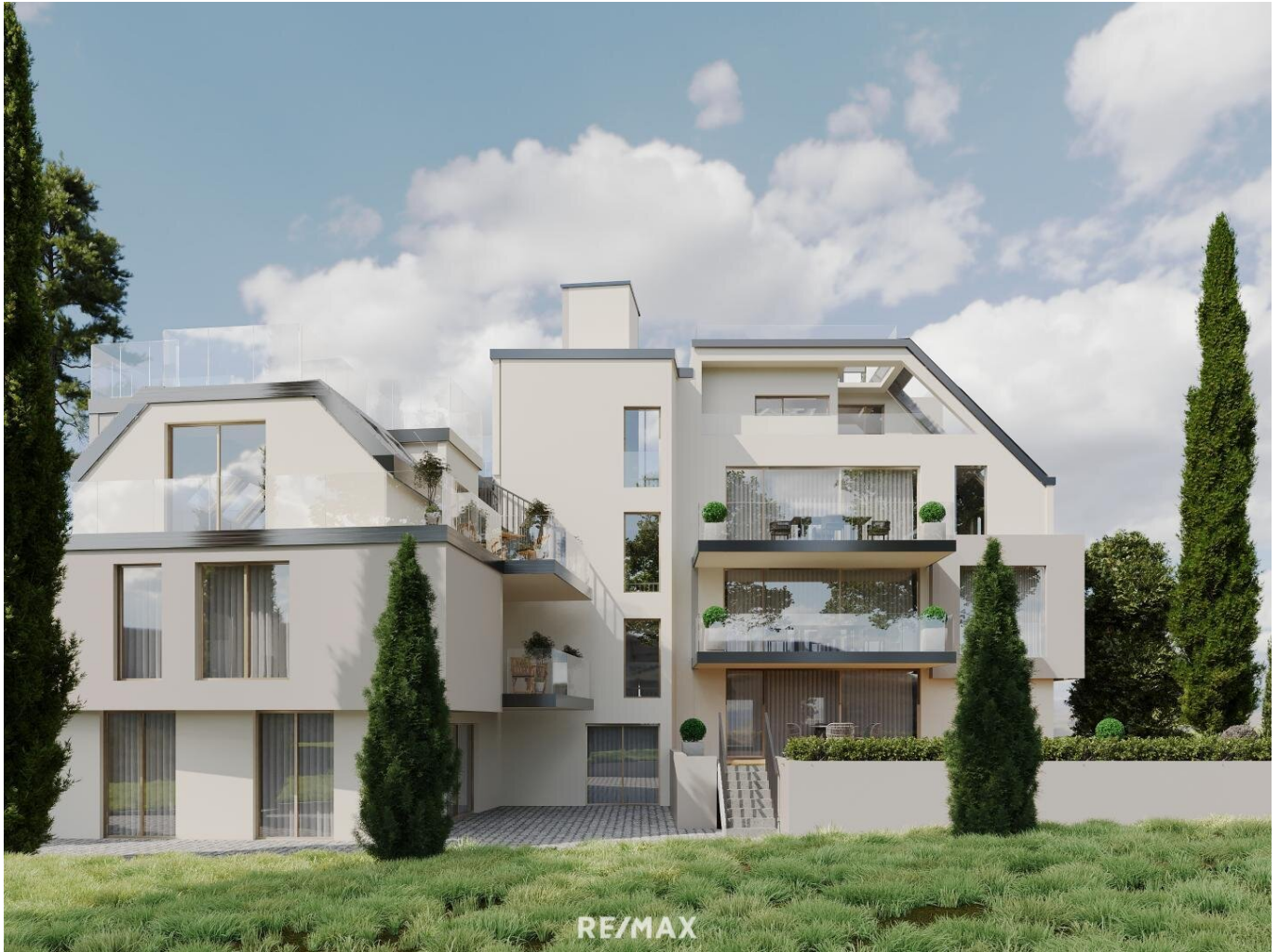
Visualisierung - Gebäude