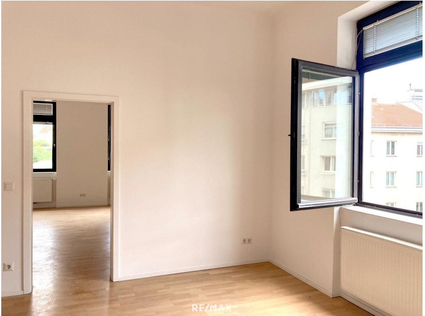
Blick vom Wohnzimmer ins Schlafzimmer