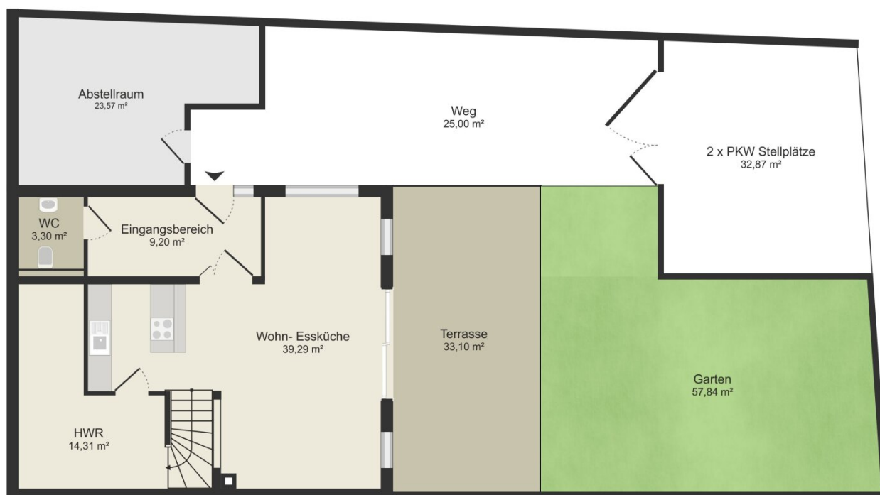
Haus 1 - Erdgeschoss