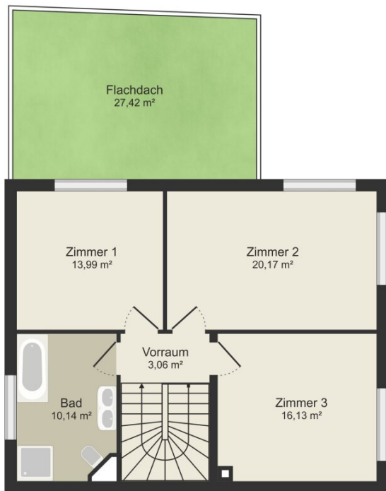
Haus 1 - Obergeschoss