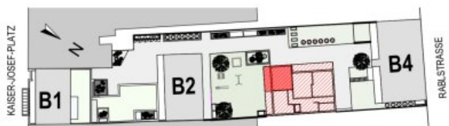
Block 3 TOP 0.4