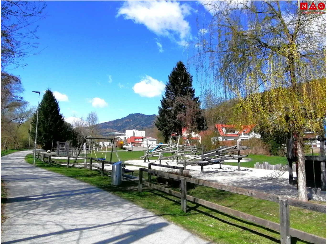
Spielplatzanlage mit Radweg am Murufer