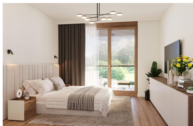
Haus 1 Gartenwohnung Schlafzimmer TOP1 und TOP2