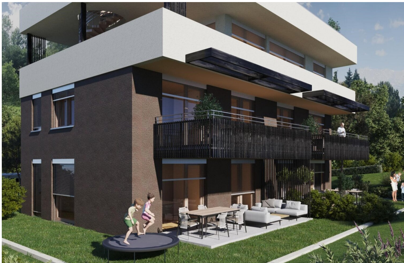
Haus 1 Gartenwohnung TOP1 und TOP2