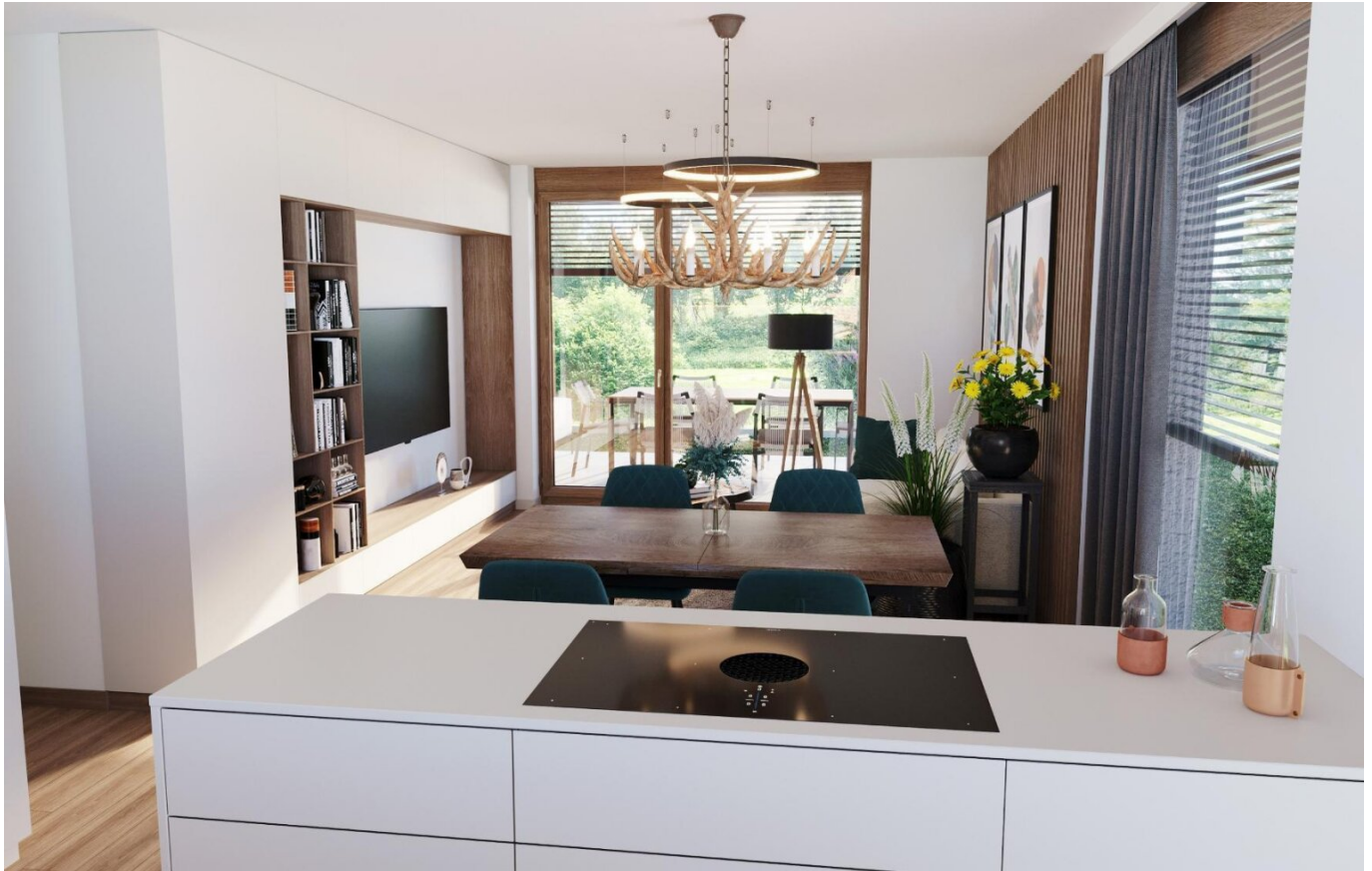
Haus 1 Gartenwohnungen Wohnbereich TOP1, TOP2