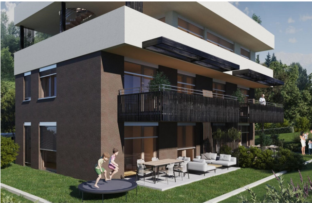
Haus 1 Gartenwohnung TOP1 und TOP2