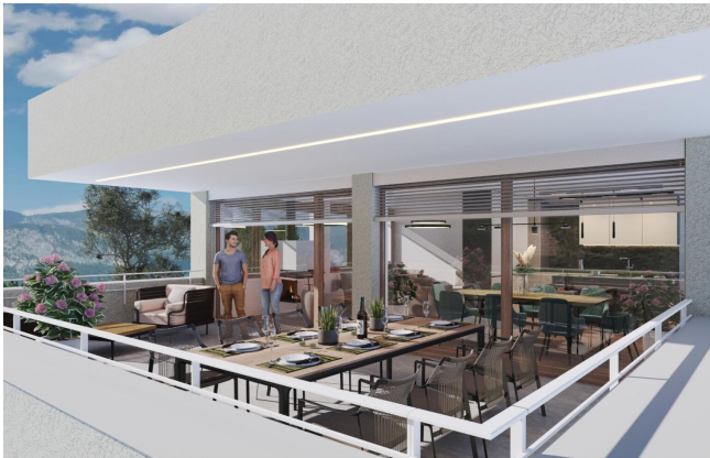
Haus 2 Penthousewohnung OG2 Terrasse TOP8