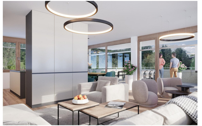
Haus 2 Penthousewohnung OG2 Wohnen TOP8