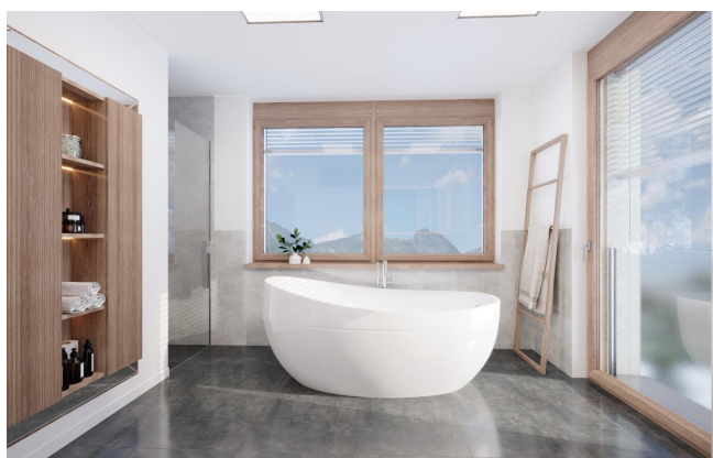
Haus 2 Penthousewohnung OG2 Bad TOP8