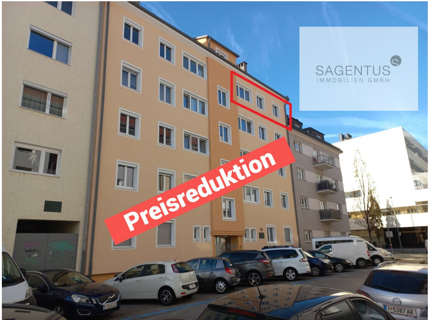
Außenansicht - Ing.-Thommen-Strasse, Innsbruck